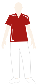
LOGOPEDISTA E FISIOTERAPISTA