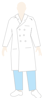
RESPONSABILE SANITARIO E AIUTO MEDICO

Nel Centro di Riabilitazione Frangi la funzione di ogni professionista all'interno dello staff è identificabile grazie all'utilizzo di uniformi di diverso colore.