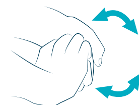
5 stringendo il dorso delle dita sul palmo