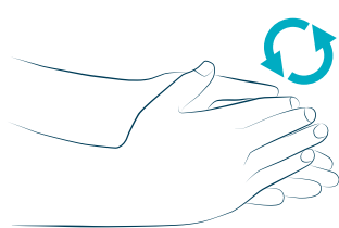
1 palmo su palmo