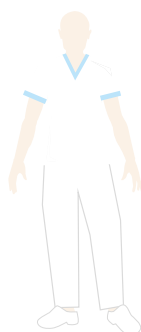
ADDETTO ALLE PULIZIE