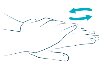
2 palmo sopra il dorso