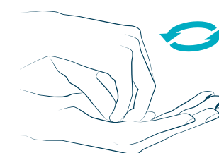
6 con le dita chiuse sul palmo