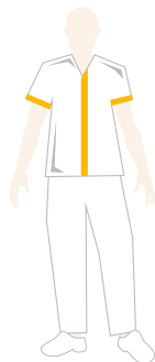
COORDINATORE SERVIZI SANITARI